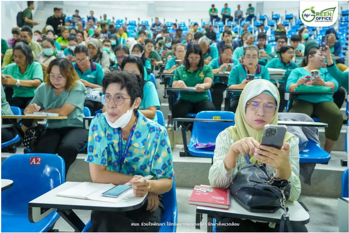
สนช. ร่วมใจพัฒนา ใช้ทรัพยากรอย่างรู้ค่า รักษาสิ่งแวดล้อม