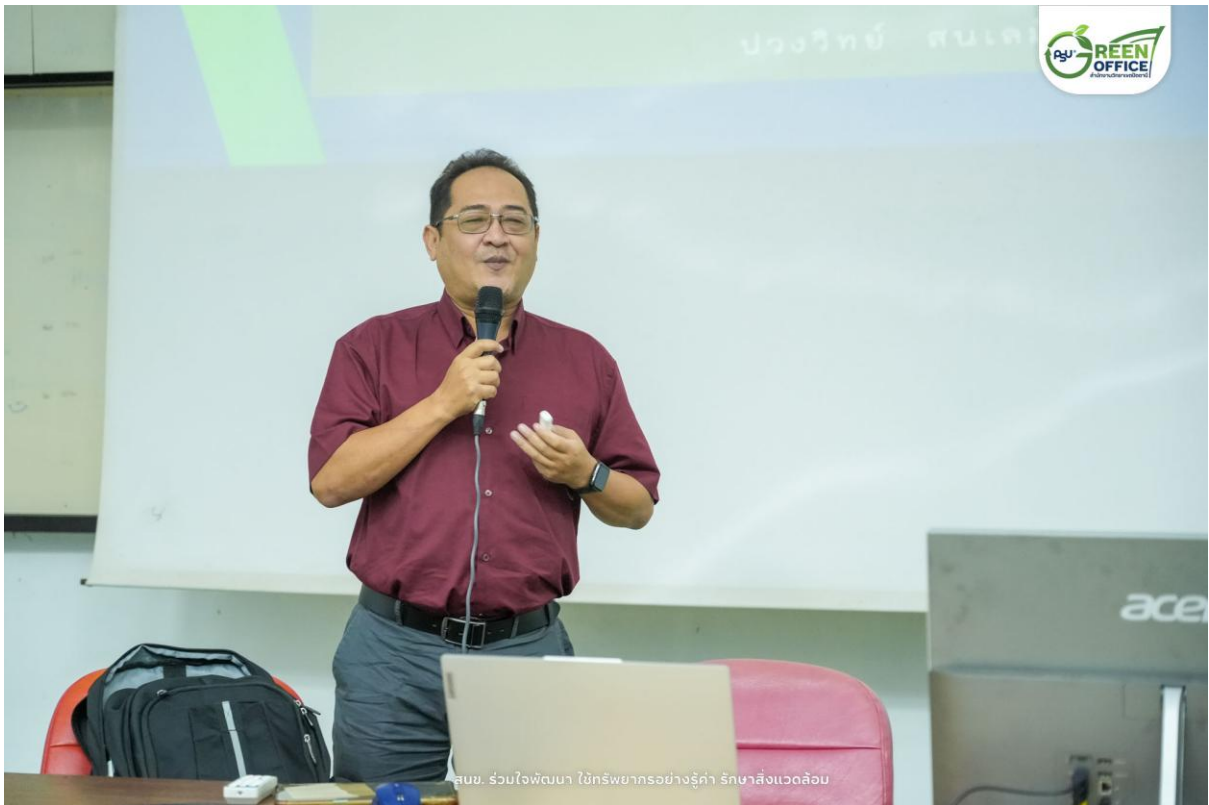
สนข. ร่วมใจพัฒนา ไข้ทรพิษหรืออย่างรู้ค่า รักษาสิ่งแวดล้อม