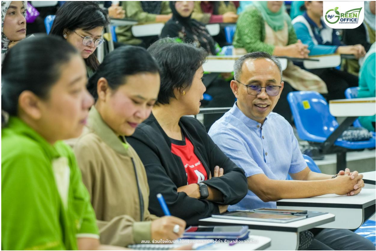
สนข. ร่วมใจพัฒนา ไข้ทรพิษหรือฝี งูรู้ค่า รักษาสิ่งแวดล้อม