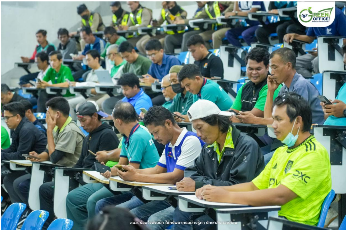
สนช. ร่วมใจพัฒนา ใช้ทรัพยากรอย่างรู้ค่า รักษาสิ่งแวดล้อม